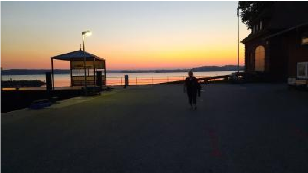
Ein romantischer Abendspaziergang beendet diesen schönen Spätsommertag.