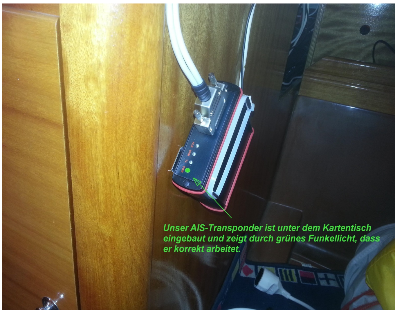
Unser AIS-Transponder ist unter dem Kartentisch eingebaut und zeigt durch grünes Funkellicht, dass er korrekt arbeitet.